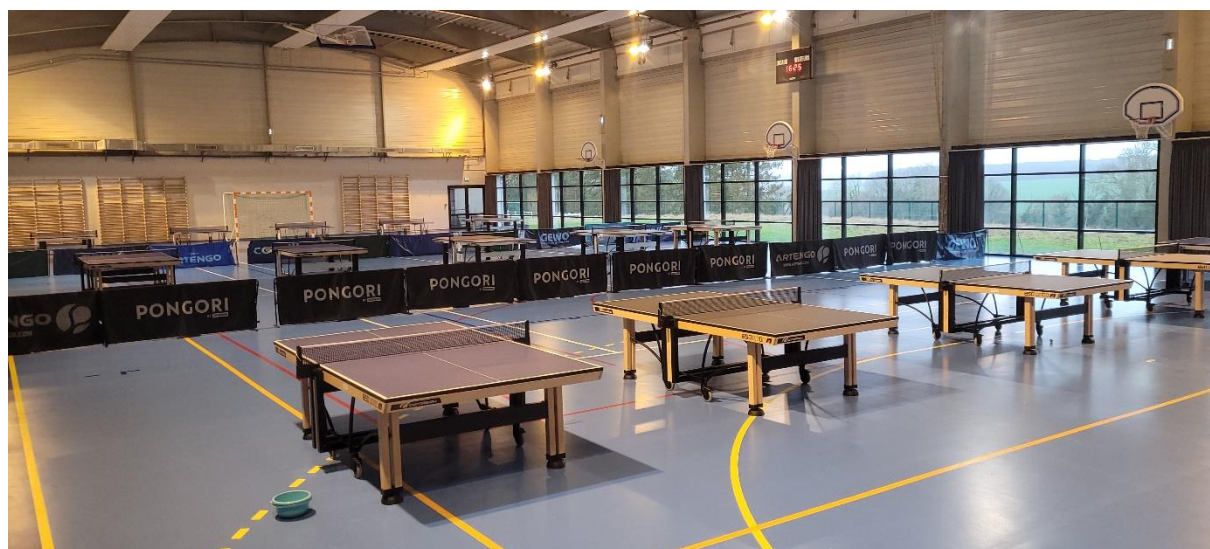
La salle avec ses 15 tables installées

* Objets publicitaires personnalisés, Stick « géant » sur séparations de tables, Flyers, Maillots avec logo